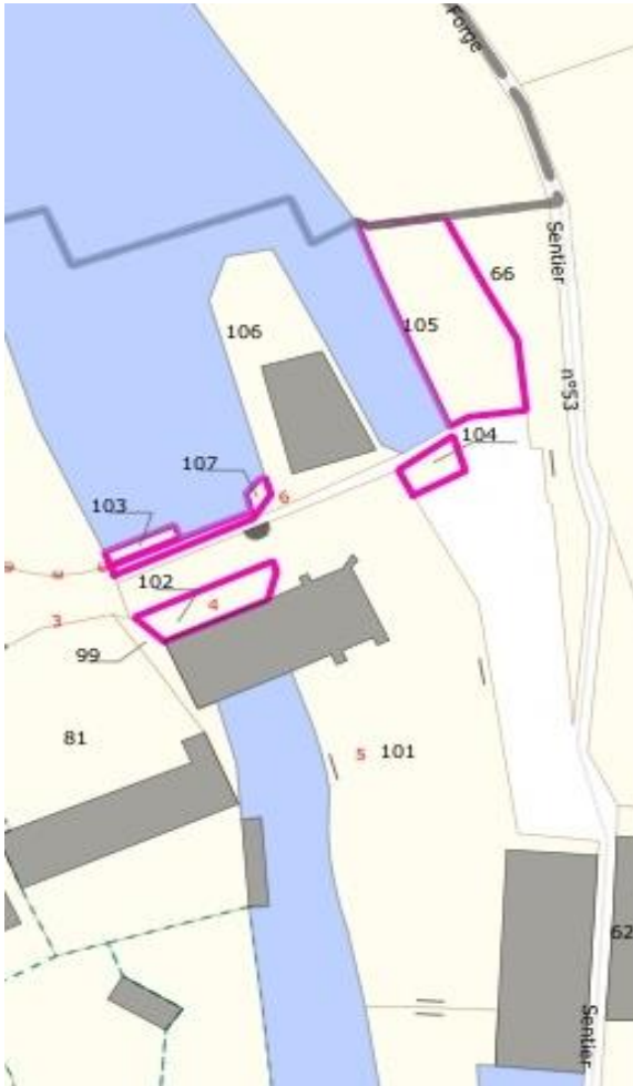
ZAEnR la Forge